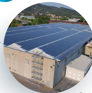
Centro de producción Fleck en Pisa, Italia