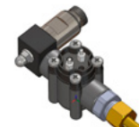
Gestión de celdas de cloro